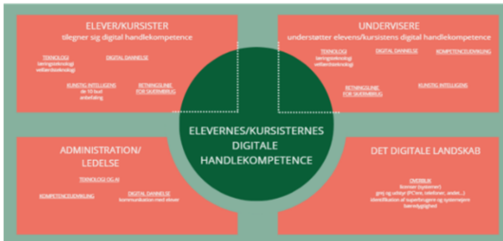
Figur 2; Digitaliseringspolitikens indhold

Der har været arbejdet med at ændre Lokale uddannelsesplaner - LUP'er. Bæredygtighed, simulation, 21. årh. kompetencer, flersprogs-pædagogik, teknologi indgår nu som tværgående dannelsesemaer. Pædagogisk assistentuddannelsen har fået en bredere curriculum, hvor der nu også indgår voksne og specialområdet.