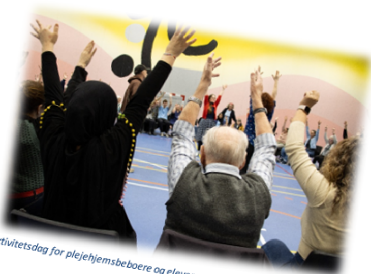
Aktivitetsdag for plejehjemsboere og elever