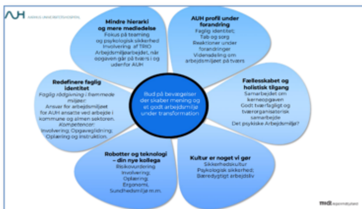
Figur 3: fra årligt temamøde i SU

Samarbejdsudvalgets årlige temamøde havde fokus på forandringer indeholdt et besøg hos Aarhus Universitetshospital om hvordan AUH arbejder med forandringer set fra forskellige perspektiver. AUH havde et indlæg om hvordan og hvilke tiltag der igangsættes for at understøtte ledelse og TRIO på AUH i transformationen.